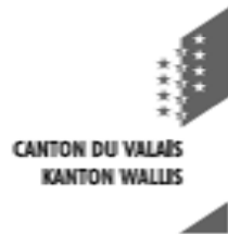
Organigramm der Kantonsverwaltung für die Verwaltungsperiode 2005 / 2009