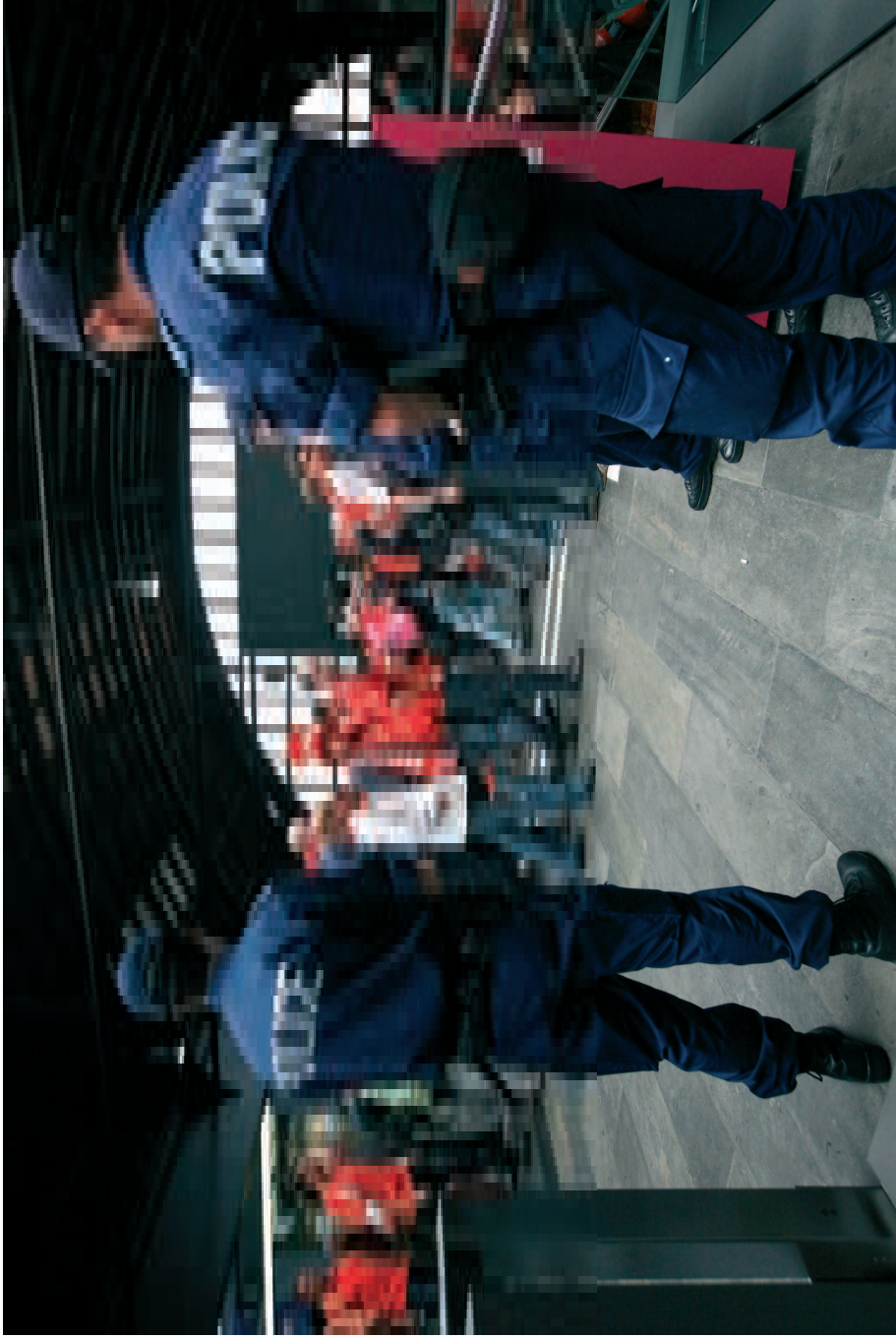
Basler Hauptbahnhof: Die Polizei hält sich im Hintergrund