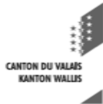
Organigramm der Kantonsverwaltung für die Verwaltungsperiode 2005 / 2009